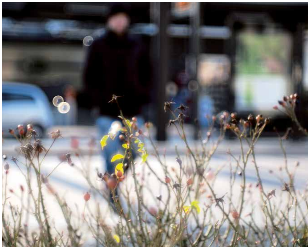
Humanismus ist eine andauernde Aufgabe des Menschen und wird zum Teil des lebenslangen Lernens.

ist, was uns Menschen vor allen anderen Lebewesen auszeichnet. Davon ist wohl im Laufe der Zeit nicht mehr viel übriggeblieben. Als klassisches Beispiel sei hier die Kernspaltung genannt. Der rein wissenschaftliche Vorgang mag wohl besonders erwähnenswert sein, was der Mensch aber daraus gemacht hat, ist dann nicht mehr auszeichnungswürdig. Unter moralischen Gesichtspunkten kann der an sich wertfreie Begriff Menschlichkeit positiv und negativ besetzt werden. Doch zurück zur Definition. Auch Humanismus ist kein biologischer Prozess, sondern man wird erst durch Selbsterziehung, also durch Arbeit an sich selbst zu einem bestimmten Menschen, der wiederum zur Menschlichkeit, also zum Humanismus in der Lage ist. Denn seinem Ursprung nach ist der Mensch geistig nicht vorbestimmt, sind sein Verhalten und seine Einstellungen zum Leben nicht festgelegt. Der Mensch ist bei seiner Geburt offen. Erst Erziehung und